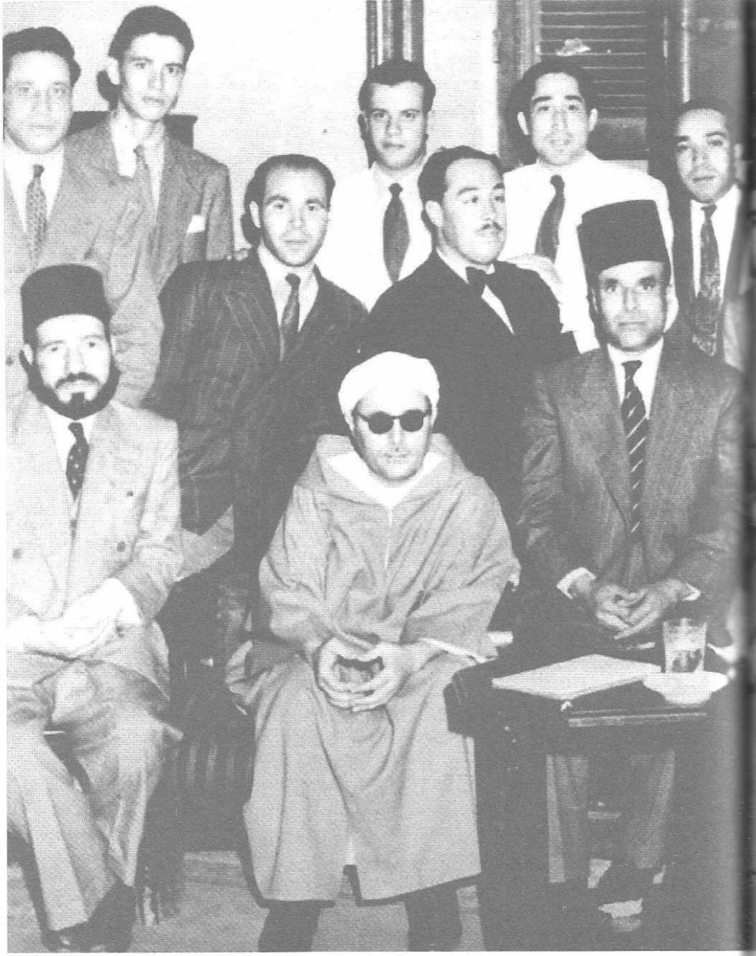
Habib Boularés.Op.Cit.p : 612.