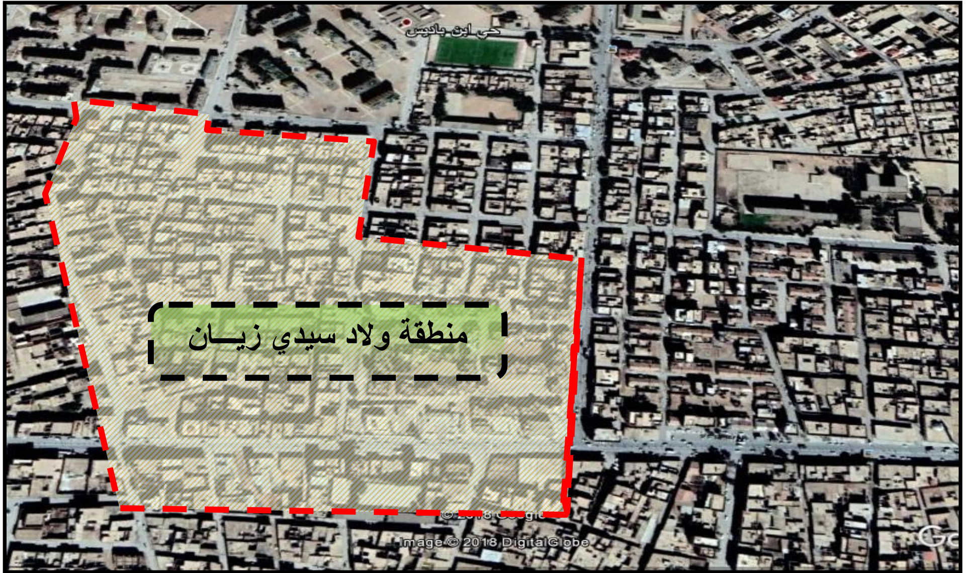
منطقة تواجد الأسر المبحوثة بمدينة عين وسارة