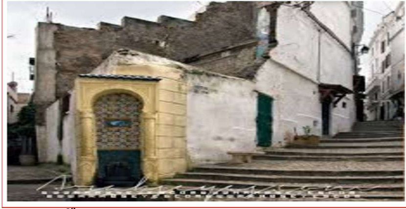
الشكل رقم (3) شارع بمدينة الجزائر في العهد العثماني 28 .