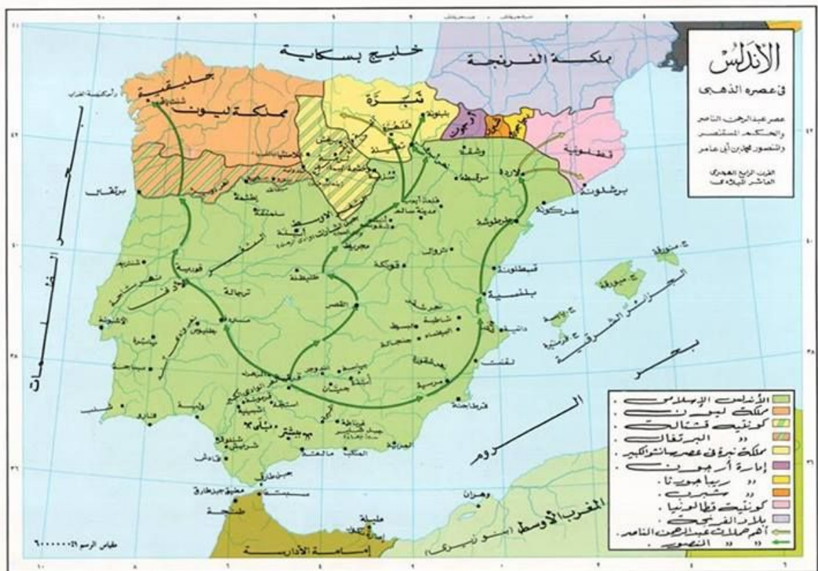
خريطة الاندلس في عصره الذهبي 1