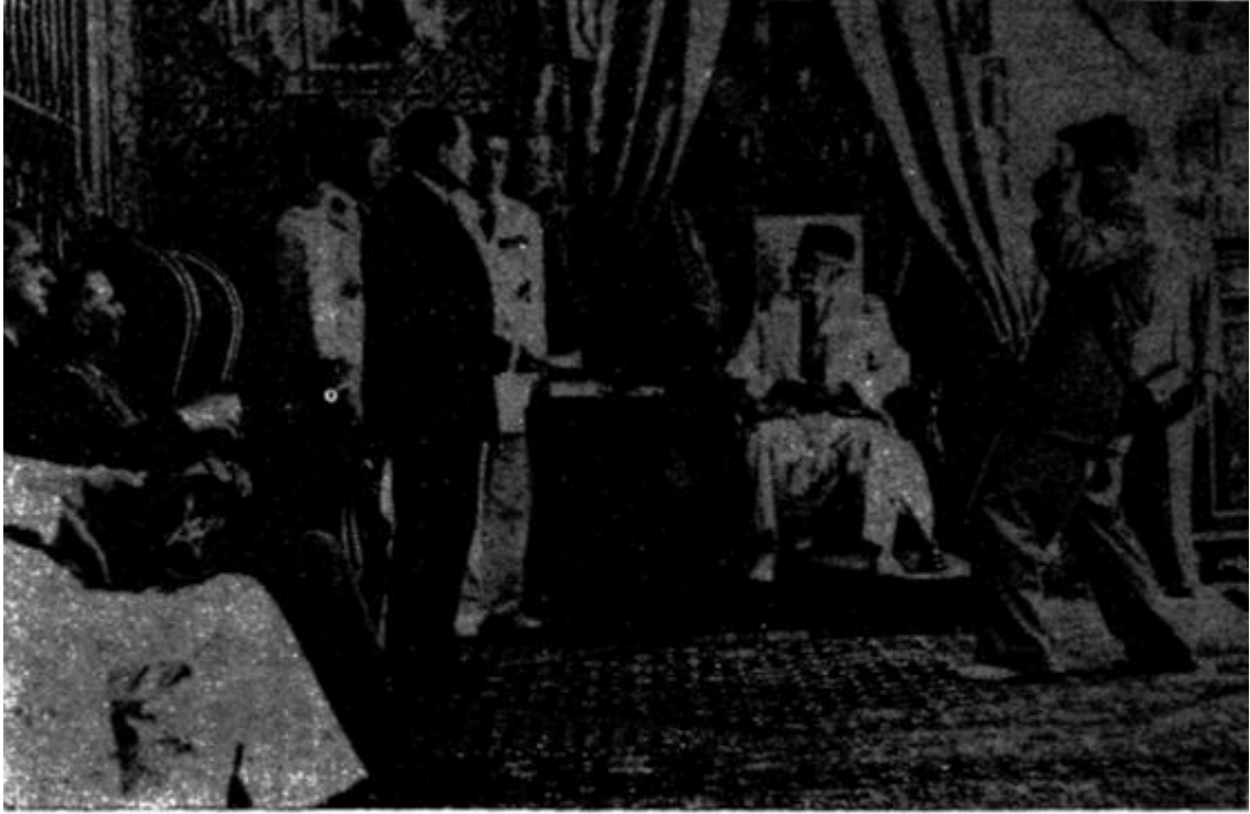
الرئيس الفرنسي مندامس فرانس يعلن أمام الباي محمد الأمين بقصر قرطاج عن اعتراف حكومته باستقلال تونس الداخلي (31 جويلية 1954) (وزارة الإعلام)