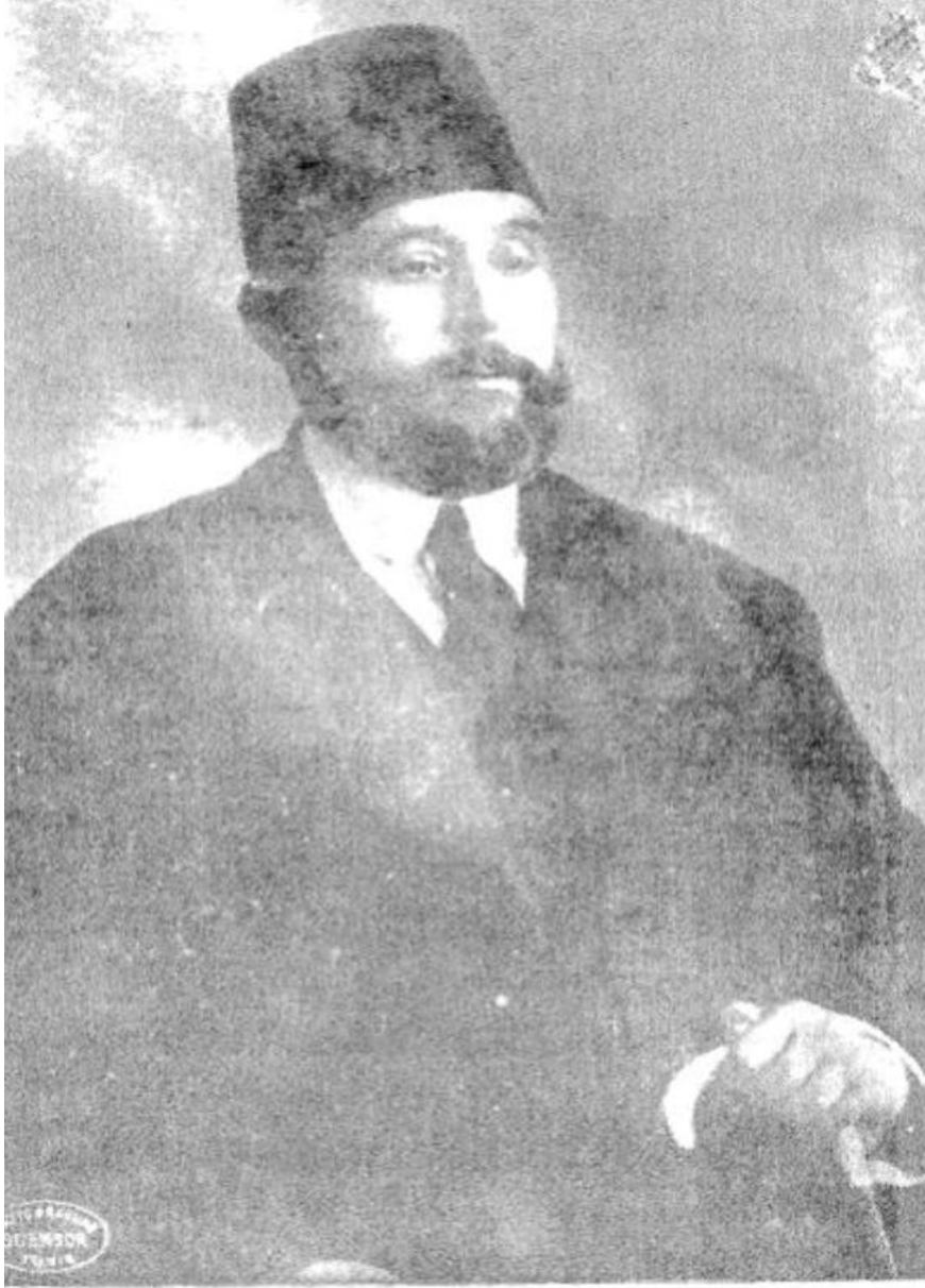
الأستاذ الشيخ عبد العزيز النعالي مؤسس الحزب الحر الدستوري والزعيم الأكبر في الحركة الوطنية