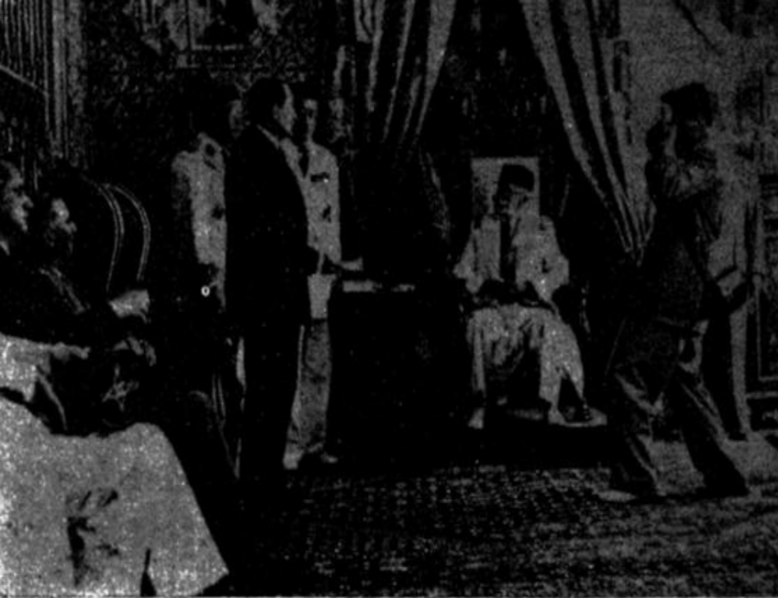
الرئيس الفرنسي منداس فرانس يعلن أمام الباي محمد الأمين بقصر قرطاج عن اعتراف حكومته باستقلال تونس الداخلي (31 جويلية 1954)