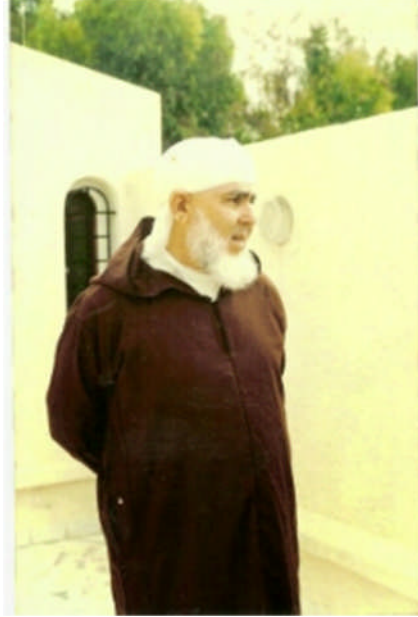
الشيخ حمزة البوتشيشي