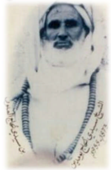
الشيخ الحاج بومدين