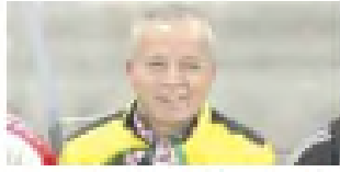
أول نائب دولي جزائري يزور المنطقة

بلومي يتضامن مع أطفال فلسطين بعد تفجيري وتوتهم عطال يدخل دائرة اهتمامات أنسفال