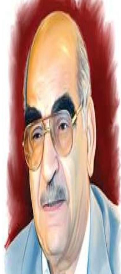
محمد عابد الجابري