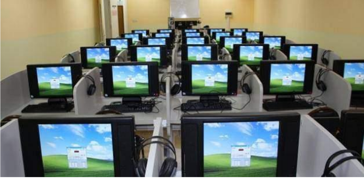
ليت مؤسساتنا تكون مجهزة