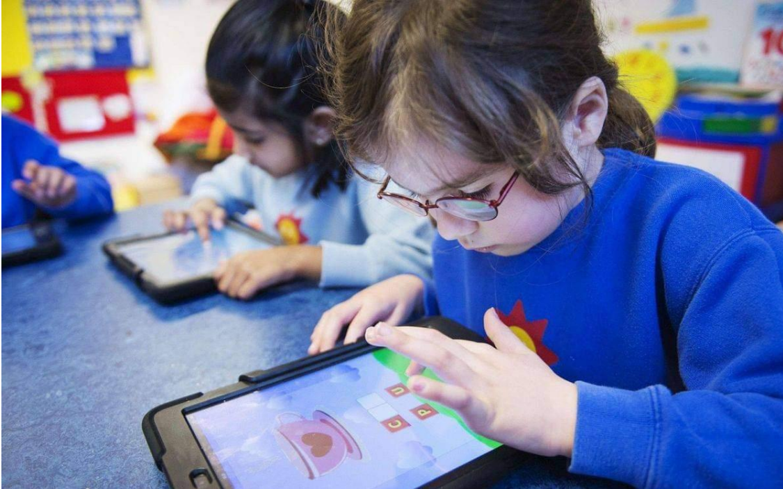
كم هي مشدودة للوحة الإلكترونية