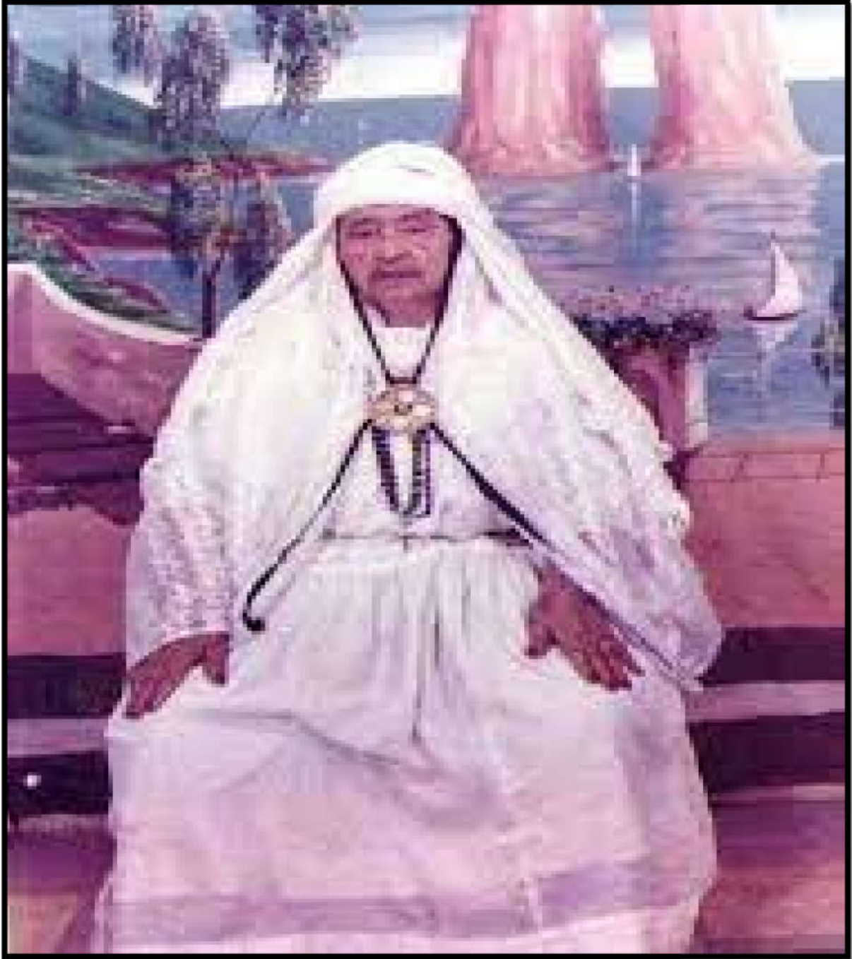
المرابطة لالة تركية