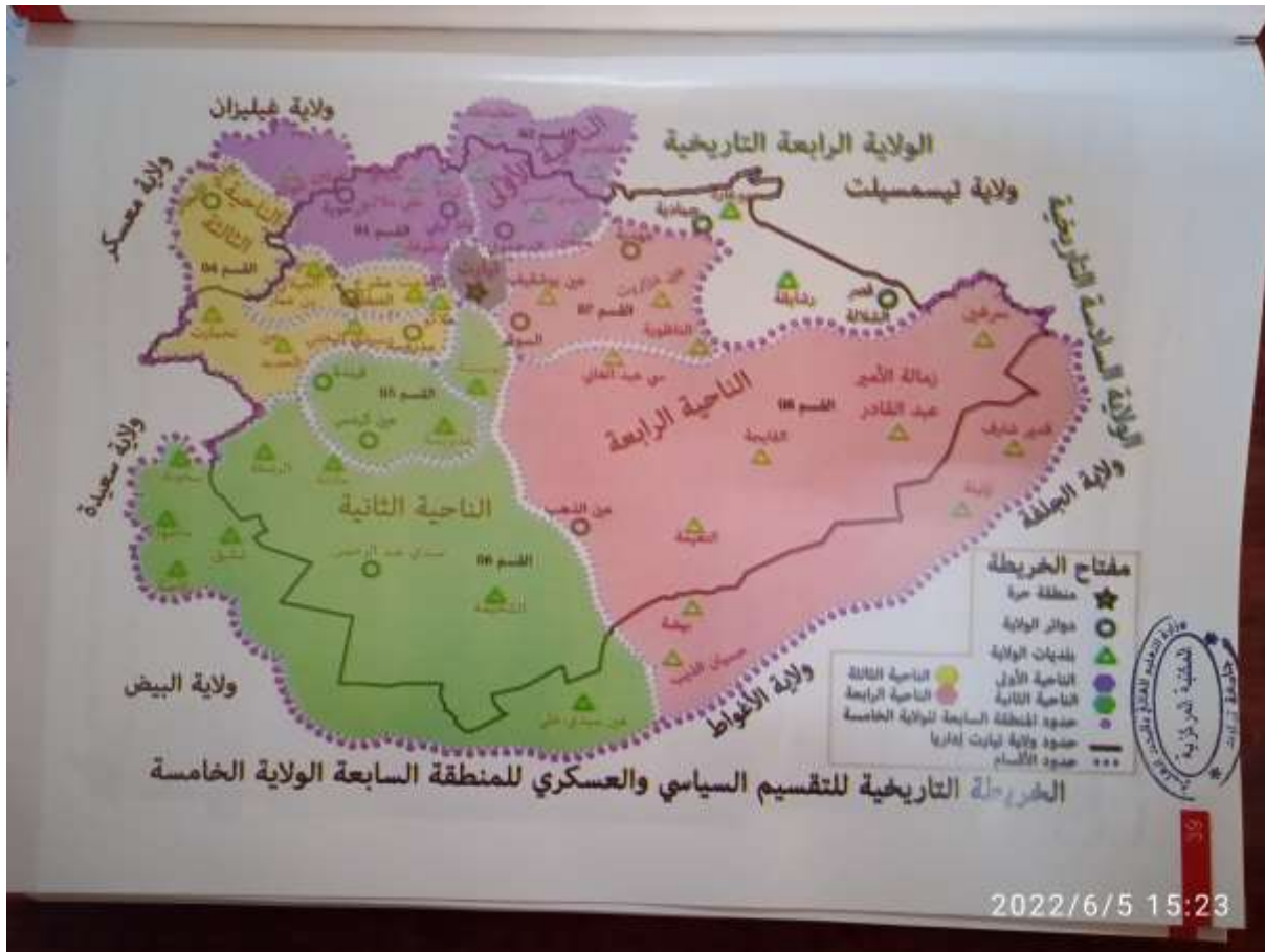
الخريطة التاريخية للتقسيم السياسي والعسكري للمنطقة السابعة الولاية الخامسة من السجل الذهبي