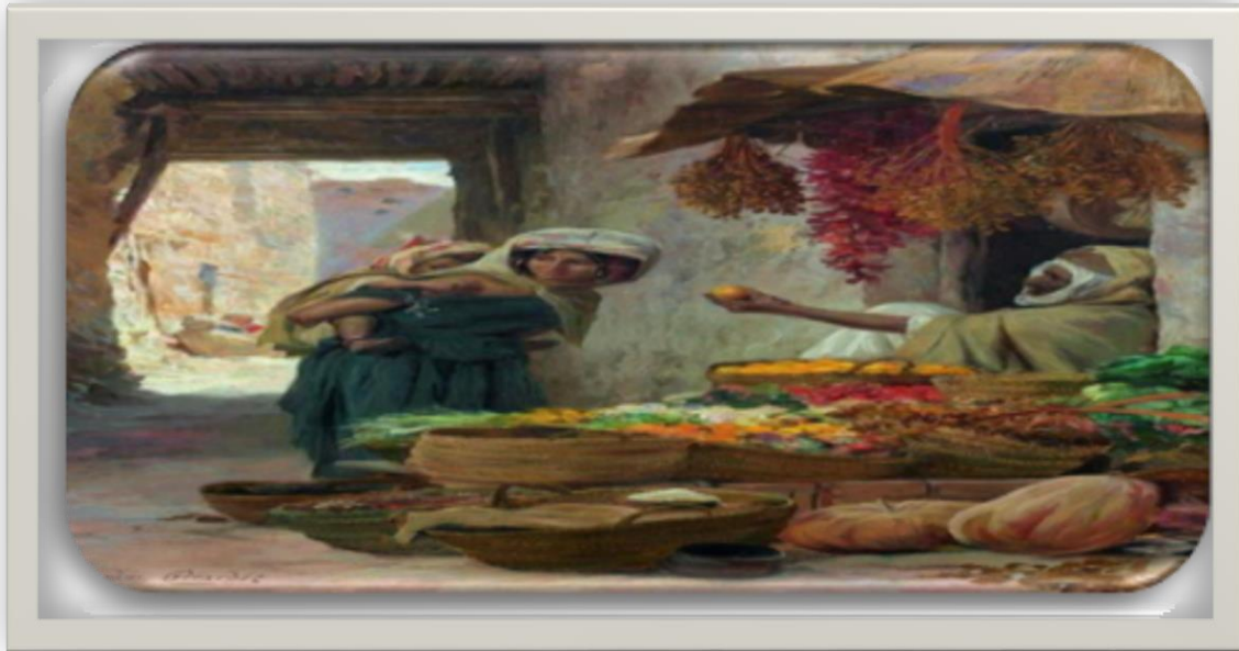
لوحة بائع الفاكهة