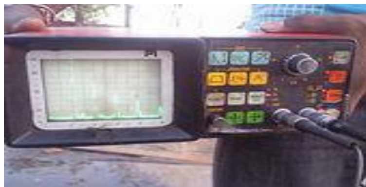
FIGURE 2-2 : MACHINE D'ANALYSE PAR ULTRASONS.

Le contrôle par ultrasons est basé sur la transmission, la réflexion et l'absorption d'une onde ultrasonore se propageant dans la pièce à contrôler. Le train d'onde émis se réfléchit dans le