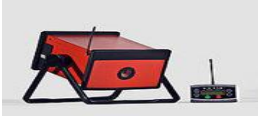
FIGURE 2-1 : MACHINE DE RADIOGRAPHIE.

ces images seront interpréter par un expert du domaine pour la détection des défauts.[5]