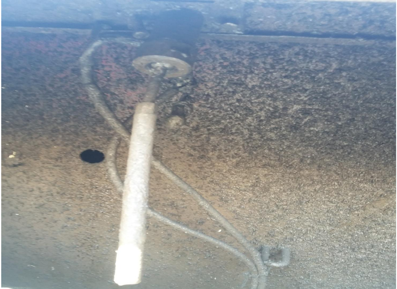
Figure IV.1: Crown-O-matic.