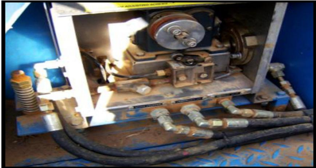
Figure IV.2: Twin Stop Bear Cat.