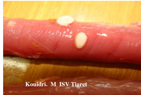
Kystes blancs sur l'oesophage

Au laboratoire de parasitologie de l'Institut des sciences vétérinaires de Tiaret, on a procédé à l'ouverture et l'incision de ces kystes blanchâtres, ne dépassants pas en général 02 cm . Cette incision a permis de constater un liquide blanc et de consistance laiteuse .